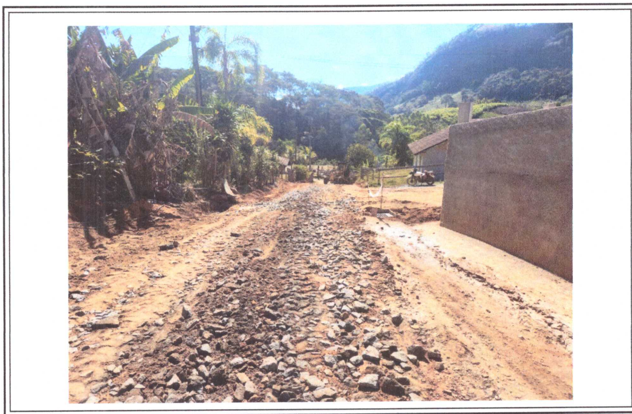
Bom Jardim, RJ, 28 de agosto de 2024.